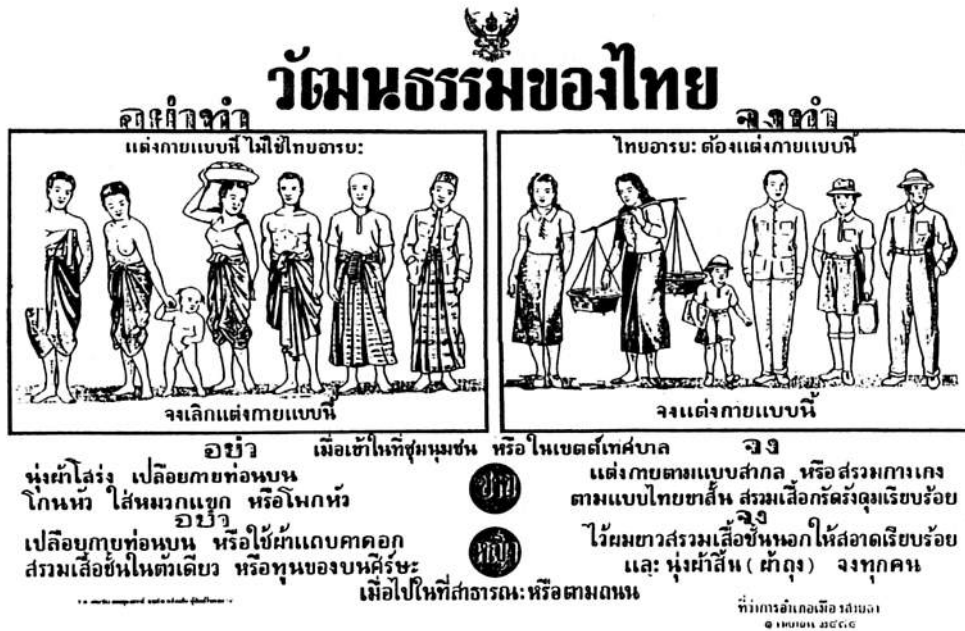
図2 服飾指導ポスター (タイ国立公文書館: PhCh. MTh./6)

このポスターは、1941年4月1日にムアン・ソンクララー郡庁によって作成されたものである。政府は内務省を通じ各県に対して県民への服飾指導を徹底させた [タイ国立公文書館内務省文書 MTh. 5.9の各公文書]。