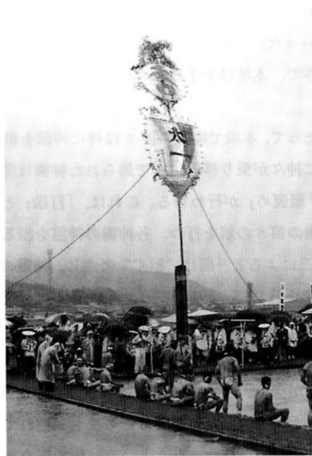
図3 伊雑宮の御田植祭

伊勢神宮の別宮といわれる伊雑宮にも御田植祭がある（図3）。これは香取神宮、住吉大社の御田植祭とともに日本三大御田植祭として知られ、国の重要無形民俗文化財に指定されている。ここでは14mもある青竹に大団扇（さしぼ）を取り付けた忌竹が主役である。団扇には松竹梅、太陽、月、千石船が描かれている。これを御田に立て、苗取りなどの行事を行う