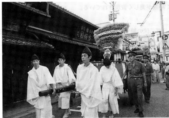
図4 采女神社の采女祭

「大和物語」にこの采女の故事がでている。それによると、美しい采女（天皇の食事に奉仕する女官）がいて、帝をひそかに慕っていた。一度だけ帝に召されたが、その後は忘れたのかいっさい声がかからない。それを悲観して猿沢の池に身を投げて死んだ、というものであ