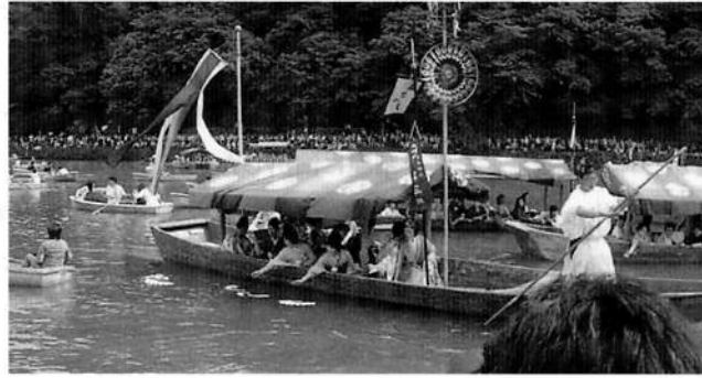
図5 車折神社の三船祭

る（大和物語；253～254）。この悲劇の伝説が采女祭に表れている。七草でつくった扇は秋の扇である。秋の扇というのは秋冷になって捨てられた扇であり、季節はずれの縁起の悪いものと考えられている。つまり帝の寵愛を失った采女の象徴であろう。これが水に浸けられると（入水の換喩的表現）、水で清められた扇の価値は逆転する。「大和物語」の中で、ちょうど帝が事の次第を知ってひどく哀れに感じ、池のほとりまで御幸し、歌を詠んだように 12) 。七草の一本一本は縁起のよいものになり、未婚女性に良縁をもたらす、というわけである。