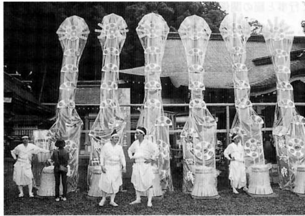
図2 那智大社の扇祭

枚扇を半円形にしたものが6組、6枚扇を円形にしたものが2組ある。6枚組で最上部にあるものには、周囲に光線状のものを取り付けて「光り」とよんでいる。これら8組の扇の中央には神鏡がある。