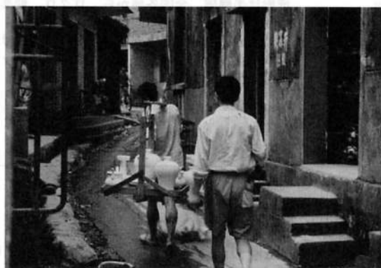
(写真3) 成形・乾燥された素地を窯まで運ぶ

門業者に依頼し、焼成された完成品を自分の店で販売するという商売をしている。第3の種類は、工房のみしかないタイプのものである。この種の業者は、一般に素地加工に専業していて、その半製品を別の業者に売ることのみを商売としている業者である。しかも、半製品を購入する顧客もこの村内に居住中しており、長期的に同じ顧客と親密な関係を築いていた。