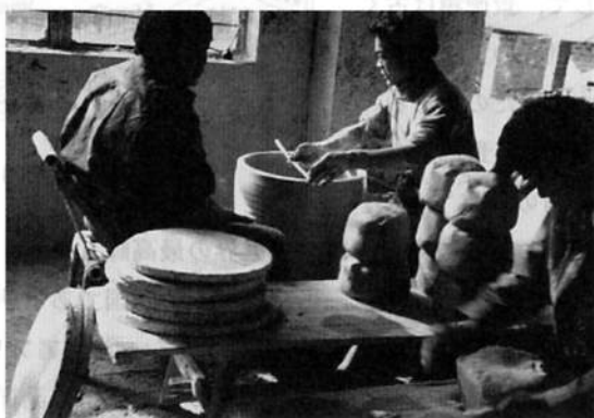
(写真1, 2) 手作業でおこなわれる新民窯

律で個性の無い工業品に倦怠感を感じ、再び伝統と個性のある手工品を求める時代の需要に合致して、こうした手工業工房が出現してきたのではないかとと思われる。ここでは、過去の民窯を「旧民窯」と呼び、手工業の伝統を復帰させたこうした新しい小規模生産者と商人達を「新民窯」と呼ぶことにする。