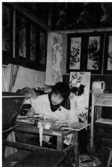
（写真6）縁起のよい模様や装飾を施す女性

しかし、時代が進むにつれて、こうした古来の伝統的題材だけでは、近代人の審美的要求や価値観に応えることができなくなった。90年代に入ってから新民窯が再興するにつれて、景德镇陶芸に新しい時代の潮流にあわせた表現が出現しつつある。例えば、一部の工房の経営者たちは、抽象画派のような模様を取り入れる試みが行われるようになっている。