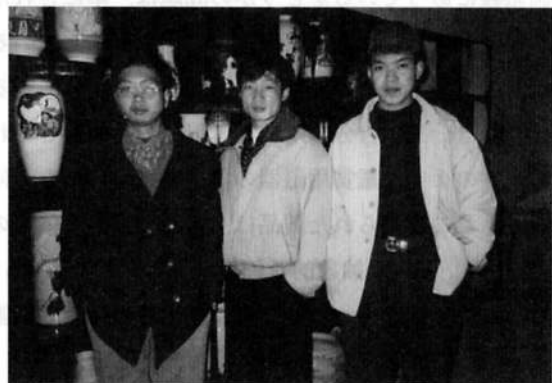
(写真5) 高い教育を受けた陶芸家

もし、どうしても民窯の製品を芸術品というのであれば、それは純粋な芸術品ではなく、生活の芸術品であり、大衆の芸術品である。