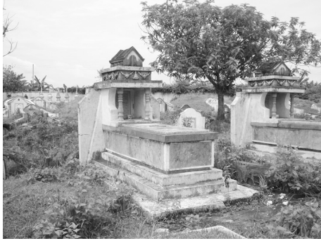
写真3 上部祠堂付箱型墓