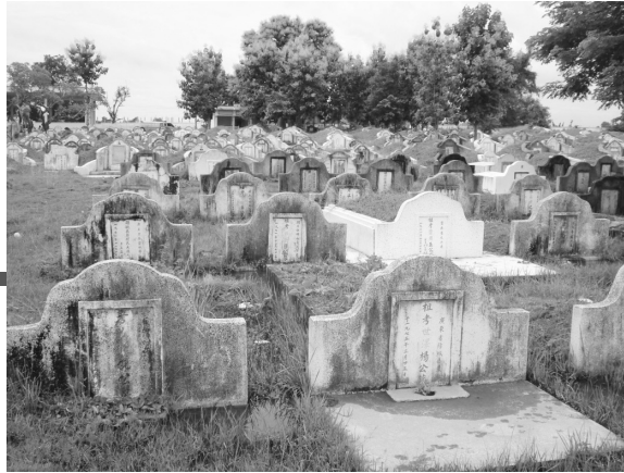
写真1 ヴィエンチャン華僑山荘 (北から南を望む。奥の左側に見える建築物は礼堂。 奥の正面は福德神廟)