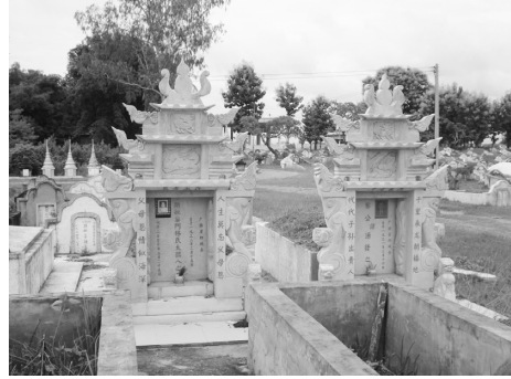
写真4 大ファサード付箱型墓

箱型墓が土葬を前提とするのに対し、仏塔型墓は火葬が前提である点で他の2型式とは大きく性格を異にする。仏塔型墓は、タイでも多く観察することができる墓型式である[加納2009:314]。仏塔には、平面プランが方形のものと円形のものがある。いずれも基壇は方形である。また、基壇上に仏塔ではなく祠堂を設けたものもある。仏塔型墓の基壇前面や堂部全面には墓誌銘が取り付けられているが、漢字で記されているものもラオス語で記されたものも存在する。基壇前面の墓誌銘裏に遺骨を収納するものと、堂部に収納ものがある。